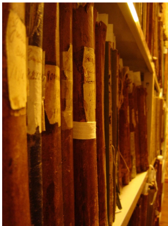
Figura 2 – Livros de Registo de Correspondência da Administração do Concelho de Tavira.