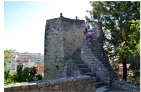
Antes da operação

As guardas são em cabo de aço, tendo uma imagem simples, de reduzido impacto visual.