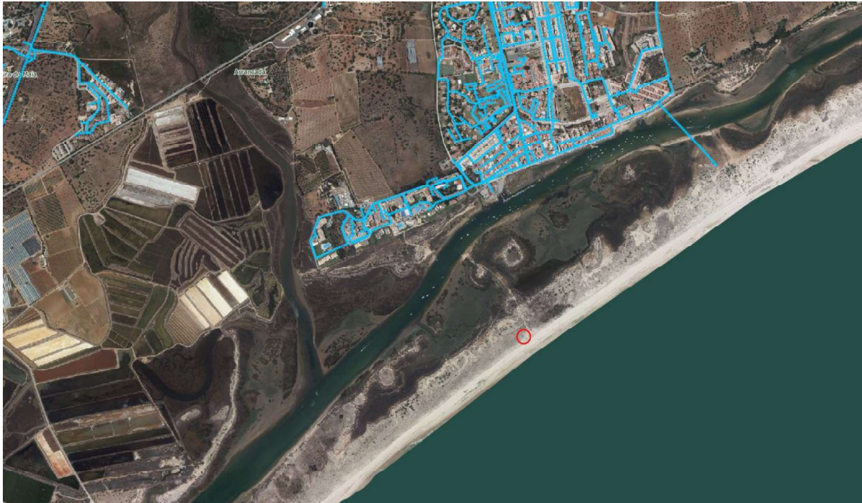
Figura 1 – Rede de abastecimento de água

Nota: o concessionário deverá requerer às respetivas entidades elementos atualizados à data da apresentação do projeto.