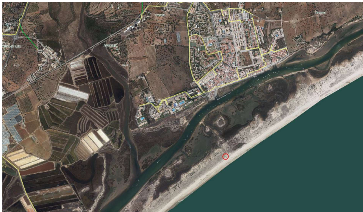
Figura 3 – Rede elétrica (MT 15 Kv subterrânea)