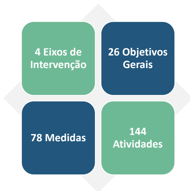
Quadro 1 | Eixo de Intervenção 1 - Dinamização do Trabalho em Rede