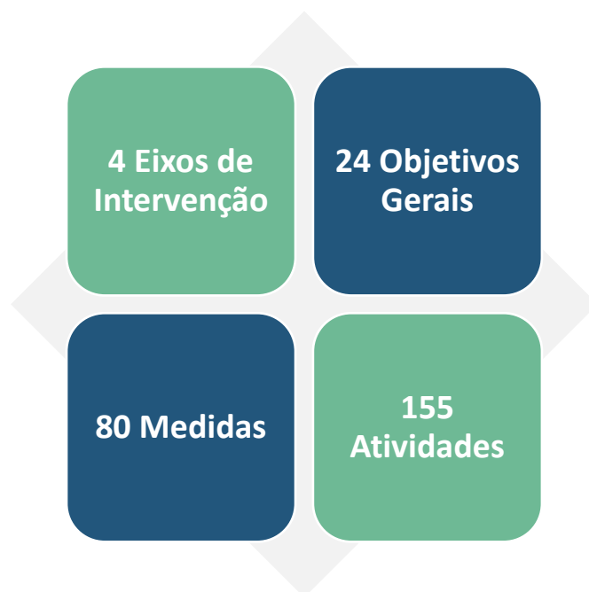
Quadro 1 | Eixo de Intervenção 1 - Dinamização do Trabalho em Rede